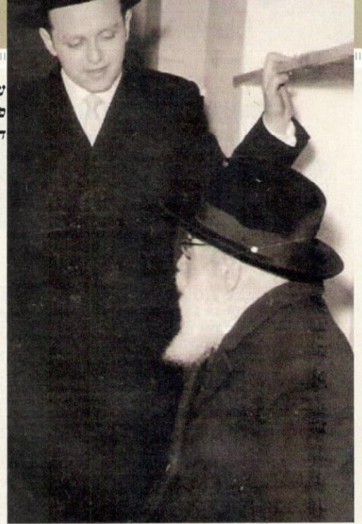
עם זקנו מרן הגר"א פינקל זצוק"ל ביום חתונתו